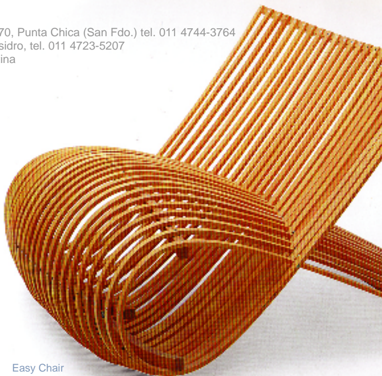
Easy Chair Marc Newson 1992 Cappellini