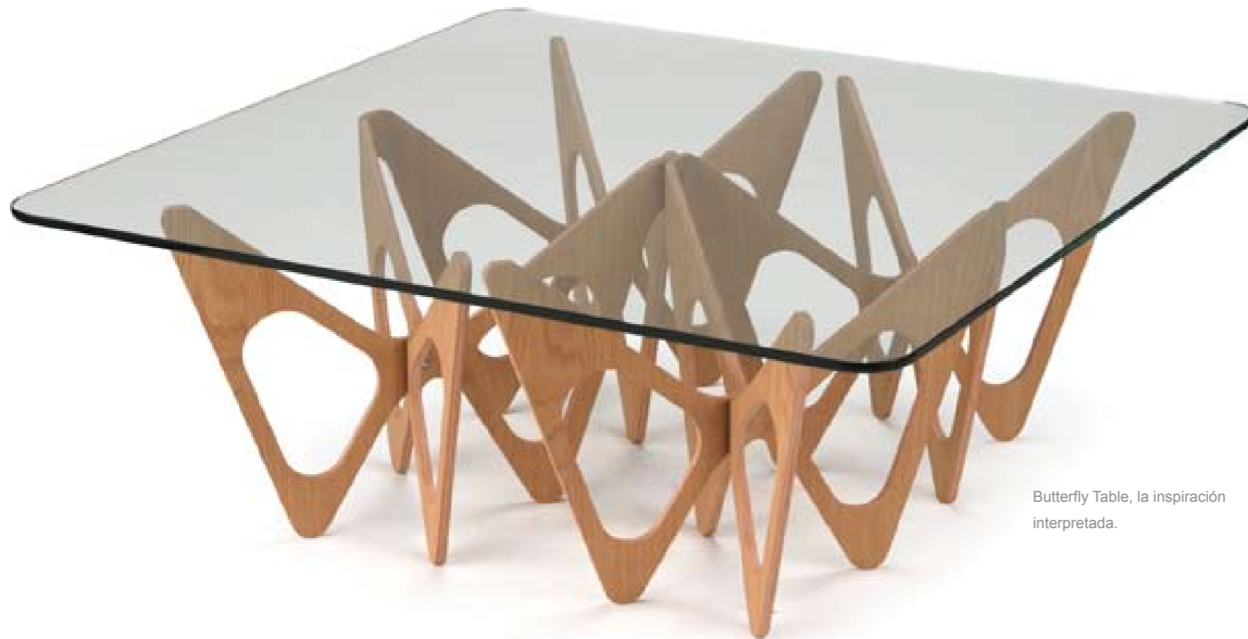
Butterfly Table, la inspiración interpretada.